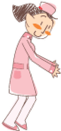
認知症看護認定看護師 看護師長

患者さん本人の思いや訴えを確認 不安やストレスの有無を把握 睡眠状況 入院前の生活情報を確認 病棟担当者からの情報 意見を 確認 入院生活環境の把握 改善に 取り組んでいます