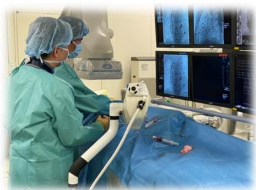
心臓カテーテル検査

小児循環器科 は、当院でもっとも特徴ある分野であり、他の施設では実際に経験することが少ない多くの症例を実際に経験することができます。中心は、先天性心疾患（CHD）であり、新生児CHDは市内のみならず広く県内外から多くの症例が紹介され、胎児診断から関わります。